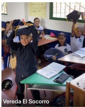
Vereda El Socorro