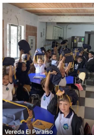
Vereda El Paraíso