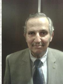
Por: Juan Felipe Restrepo