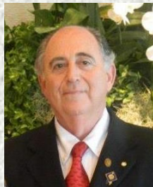
Por: Daniel Sadofski