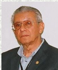
Por: Álvaro Villegas Past Gobernador