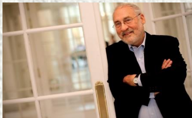
Dr. Joseph E. Stiglitz. Premio Nobel de Economía 2001.

Este artículo es un resumen de la intervención del Dr. Joseph E. Stiglitz, premio Nobel de Economía en el año 2001, durante su intervención en el Foro Mundial Urbano llevado a cabo en Medellín entre el 5 y el 11 de Abril de 2014.