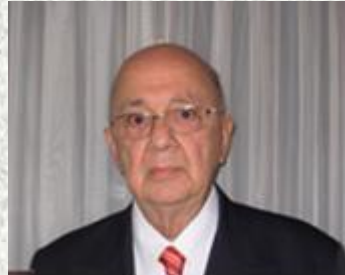
Por: Enrique Uribe Past Gobernador

Por los años de 1986 con los beneficios de un partido de Fútbol que se hizo en combinación con el Hospital San Vicente Fundación, se recogieron unos 3.500.000 pesos colombianos, los que de común acuerdo con ellos, sirvieron para crear un fondo cuyo producido fuera la mitad para el hospital y la otra mitad para crecer el fondo.